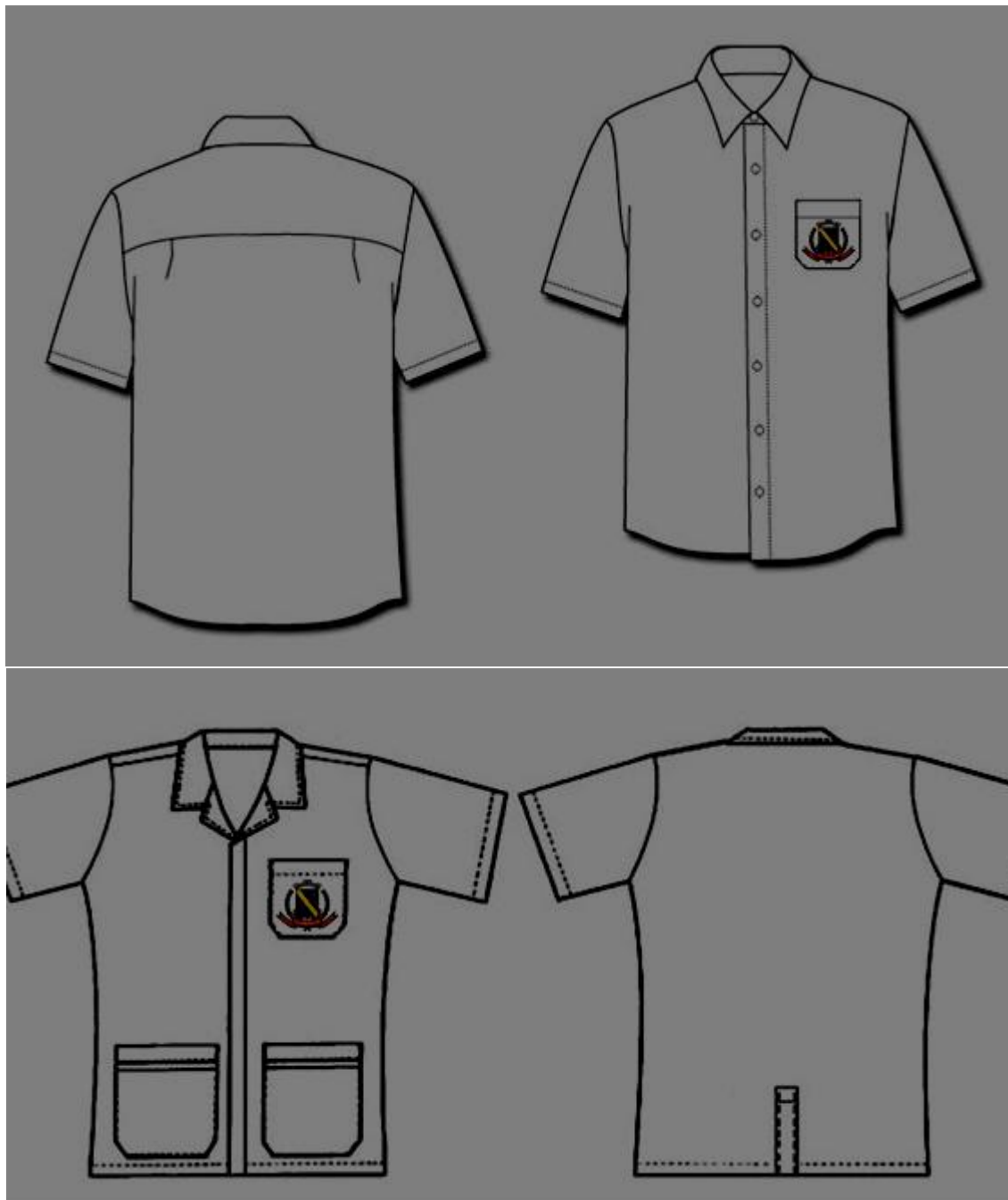
Figura 5- Jaleco Manga Curta/Programa Melhor em Casa