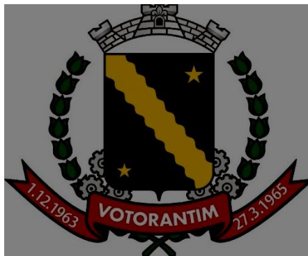
Figura 1-Brasão do Município de Votorantim