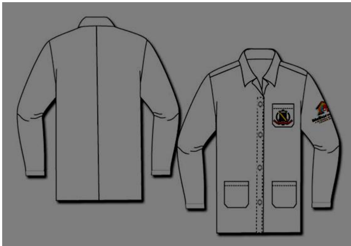
Figura 6- Jaleco Manga Longa do Programa Melhor em Casa