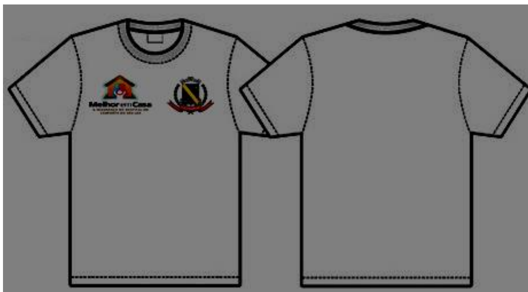
Figura 7- Camiseta Manga Curta do Programa Melhor em Casa