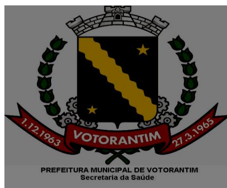
Figura 3 : Brasão do Município+Identificação da Secretaria