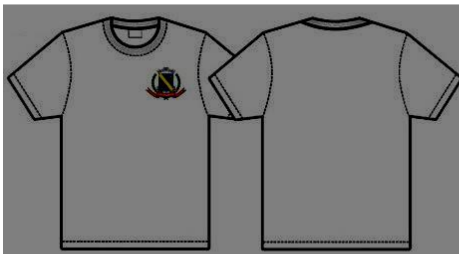
Figura 9: Camiseta PSF