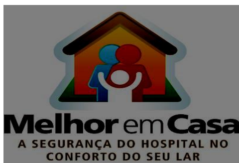
Figura 2- Logo do Programa Melhor em Casa