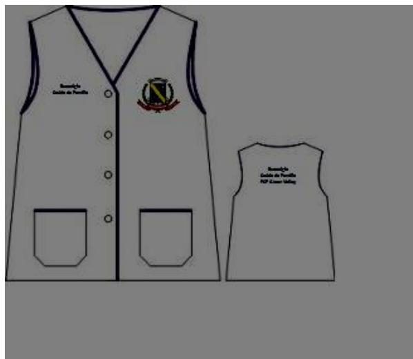
Figura 8 - Jaleco sem mangas/Programa Saúde da Família